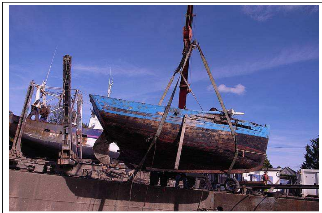
La Jolie brise avant restauration

Le projet consiste donc à remettre en parfait état de navigabilité ce bateau, de mettre en place d'un mat et d'une voilure "aurique" typique du port.