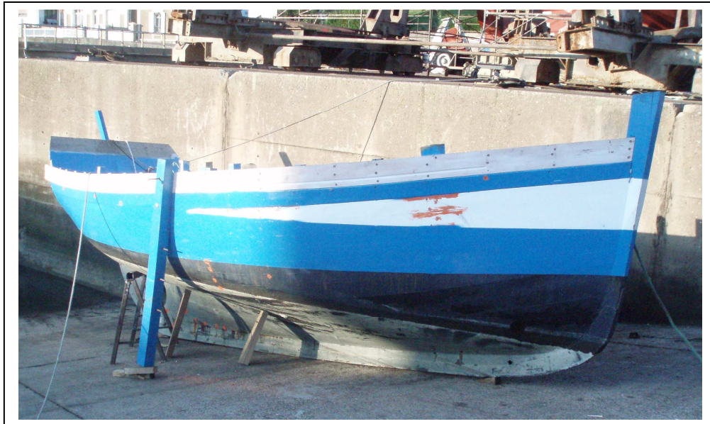
Restauration de la coque, mise du dernier bordé

Mise en place du moteur pour novembre 2008