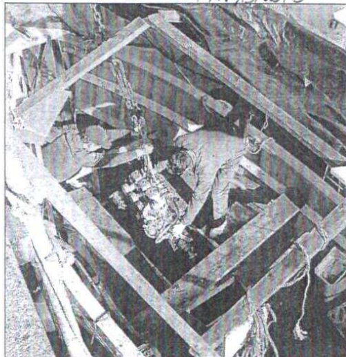
L'opération délicate de l'installation du moteur.

L'assemblée générale de l'association aura lieu le samedi 7 mars au centre culturel à 10 h. Toutes les personnes intéressées par la sauvegarde du patrimoine portais seront les bienvenues.