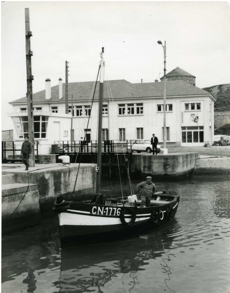
Le Julien Germaine 1975 environ

Fin 2012, remise à l'eau et installation d'un mât de charge et de tout l'accastillage. Grâce au plan d'époque un ou plusieurs chaluts seront fabriqués par d'anciens marins pêcheur.