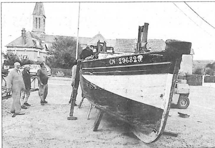
Une entrée en fanfare, pour la Saint-Jacques , nouvelle chaloupe à restaurer.

La restauration débutera par la Saint-Jacques en meilleur état que le Julien Germaine . Cela permettra de disposer plus vite d'un deuxième bateau. La St Jacques sera mise à la voile.