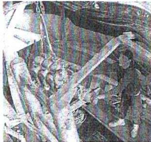
Vendredi, « La Jolie Brise » a reçu son moteur entièrement restauré.

Dans le même temps, les charpentiers ont bien avancé : la lisse, le couronnement arrière, les serres de banc ceinturant la chaloupe et le bâti du