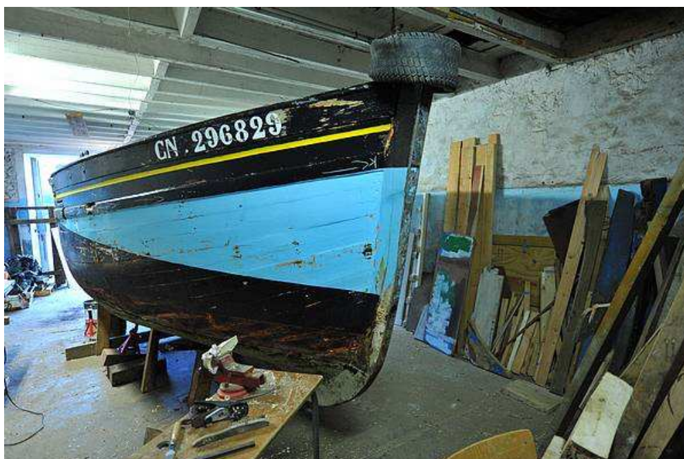
Le Saint Jacques à l'abri