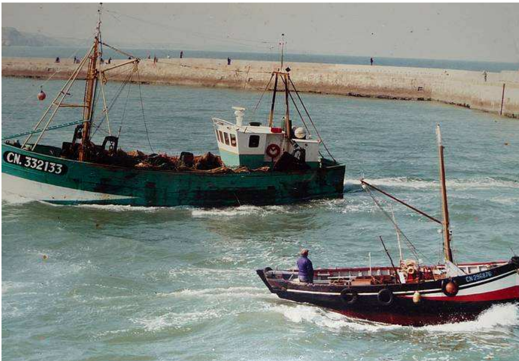
La Pointe du Hoc rentre, le Julien-Germaine sort.