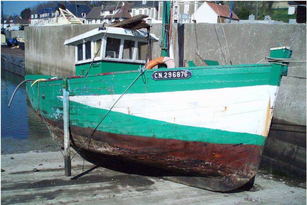
Le Julien-Germaine 08/2009

Le but de la restauration est ici légèrement différent, l'idée est de remettre la chaloupe à l'identique de ce qu'elle était dans les années 1970, ce qui est bien différent de la photo ci-dessus qui montre son état actuel.