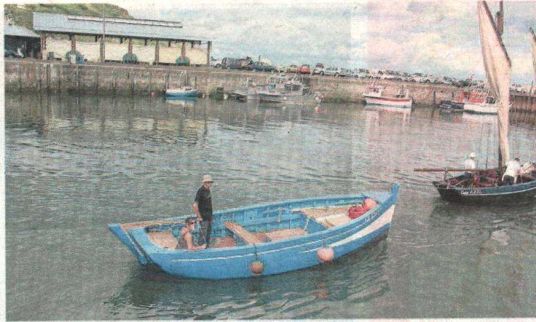
« La Jolie Brise », la chaloupe remise à l'eau par les membres de l'association « L'équipage de la Jolie Brise », lors d'une sortie en juillet.