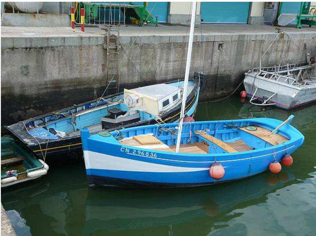
La Jolie Brise et le Saint Jacques